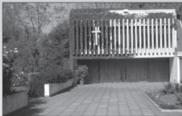
Capilla Pablo Nogués